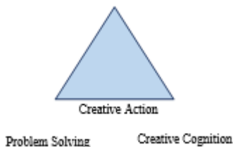
Gambar 3. Model Kreativitas pada Penggunaan ICT dalam Pembelajaran

Kreativitas dalam pemecahan masalah berkaitan dengan macam-macam aktivitas online dan perilaku yang berbeda seperti manipulasi grafik, penggunaan warna, animasi, dan efek. Kreativitas dalam interaksi sosial berkaitan dengan pemanfaatan ICT untuk aktifitas diskusi, chat , mengekspresikan diri melalui komunikasi berbasis teks di lingkungan elektronik. Sedangkan kreativitas dalam aspek kognitif mencakup pembuatan dan pengelolaan personal website, menulis kreatif menggunakan pengolah kata, beradaptasi dan melakukan penelusuran cara bekerja dan belajar yang baru dalam menggunakan lingkungan elektronik.