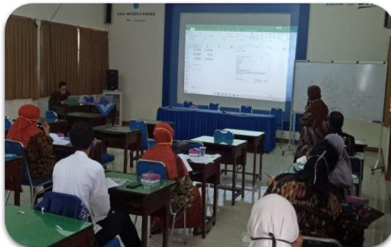
Gambar 1. Workshop pada tanggal 4 November 2020

Narasumber menjelaskan terlebih dahulu memberikan pemahaman tentang definisi distribusi normal, bentuk kurva dari distribusi normal, dan pemakaian distribusi normal. Distribusi ini sangat penting dalam ilmu-ilmu sosial karena distribusi ini menjelaskan banyak karakteristik manusia (Willard, 2020). Perhitungan nilai z score dan perhitungan peluang dalam distribusi normal juga dijelaskan secara rinci. Peserta juga diberikan latihan soal dengan penyelesaian secara manual dan menggunakan Microsoft excel. Pada penyelesaian dengan microsoft excel, peserta dijelaskan tentang sintaks NORMDIST(x, mean, standard\_dev, cumulative) .