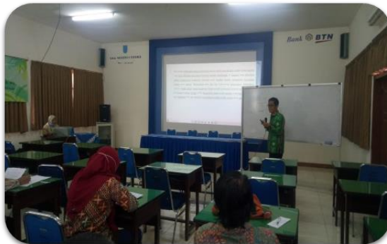
Gambar 3. Workshop pada tanggal 17 November 2020

Suparman (2015) menerapkan distribusi normal yaitu nilai z -score untuk menentukan nilai batas lulus ( cut score ). Penggunaan z -score dalam penentuan nilai batas lulus melibatkan sejumlah kegiatan penilaian, seperti nilai pekerjaan rumah (PR), nilai tugas, nilai ujian mid, kemudian semua komponen nilai tersebut dicari reratanya. Jadi dengan pendekatan berdasarkan z -score, nilai KKM ditentukan dengan rerata nilai kegiatan penilaian sebelumnya.